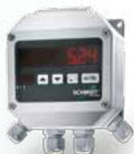
LED-Anzeige im Wandgehäuse