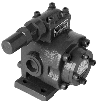
ATP - HABVB