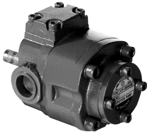
ATP - HA