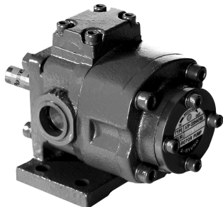
ATP - HAB