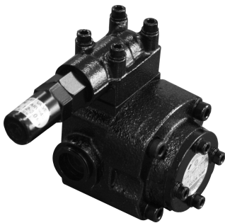
ATP - HAVB