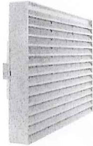
LS 1 K