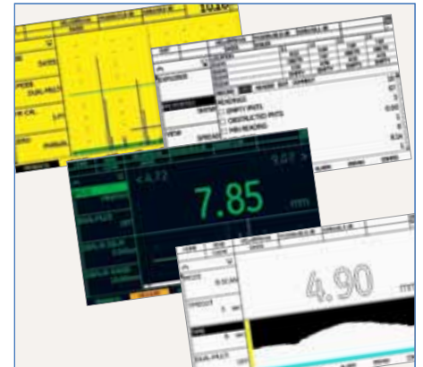
Anzeigen, die für Jedermann geeignet sind: großer A-Scan, Datenlogger, Wanddicke, B-Scan.