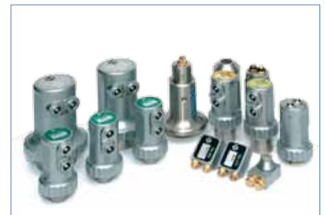
Unterstützt eine große Auswahl an Standardprüfköpfen