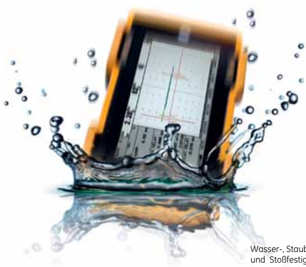
Wasser-, Staubsichtigkeit und Stoßfestigkeit