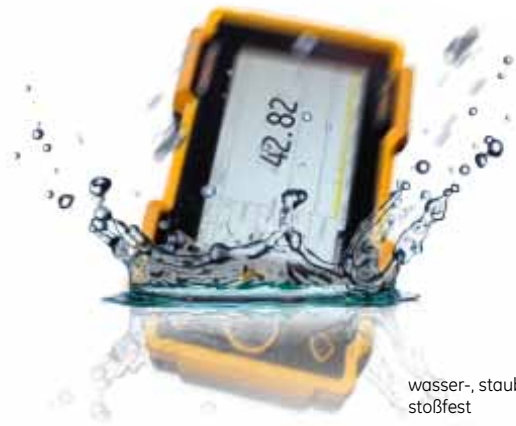
wasser-, staubdicht und stoßfest