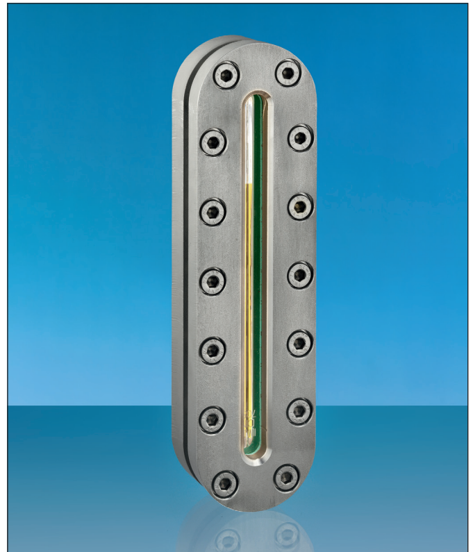
Kompletter Lieferumfang einer Lumiglas Längsschauglas-Armatur

Das Anziehen der Schrauben muss gleichmäßig wechselseitig gegenüberliegend erfolgen, beginnend von der Mitte der Armatur aus, dann über Kreuz bis zu den beiden Enden.